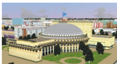
Рис.1 Мир Кибер